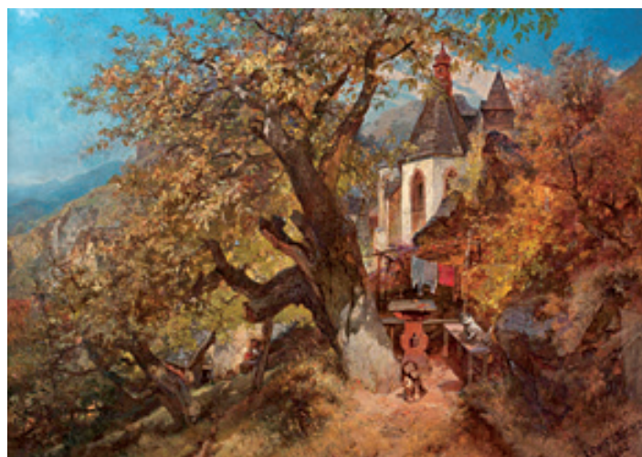
E. Oehme, Ve městě Krupka, 1902 (Wikimedia)