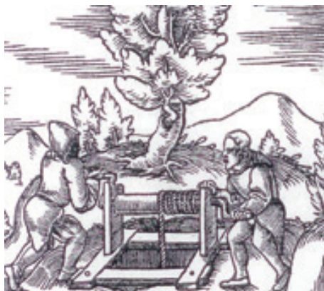
Horníci u ručního vrátku (Agricola)

Pokud to prostory dolů umožňovaly, třídil se narubaný materiál v podzemí pomocí dřevěných žlabů