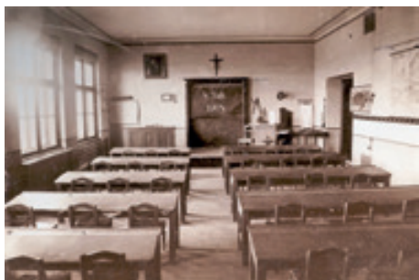
Škola v Soběchlebech, 1904