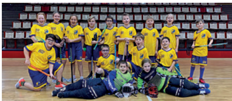
Elévci na turnaji v Chomutově.