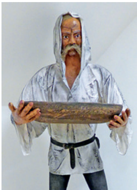
Horník s dřevěnými neckami (IC hornické krajiny Krupka)

Narubaná hornina se v dolech přemísťovala ně-