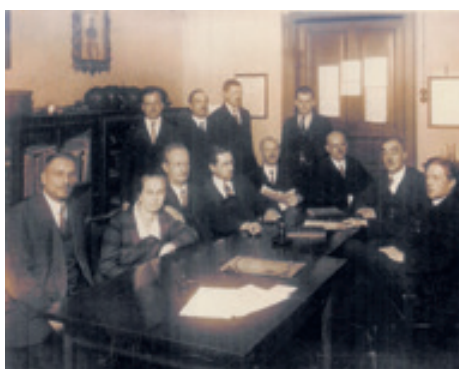
Učitelský sbor krupské školy, 1926