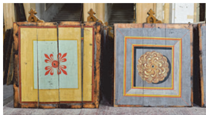
Ukázka přemalované stropní kazety a kazety původní po zrestaurování