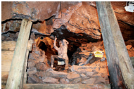
Práce horníka s želízkem a mlátkem (štola Starý Martin)