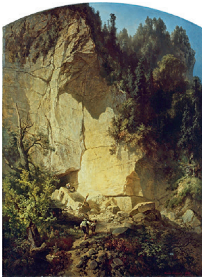
E. Oehme, Kamenolom v Saském Švýcarsku