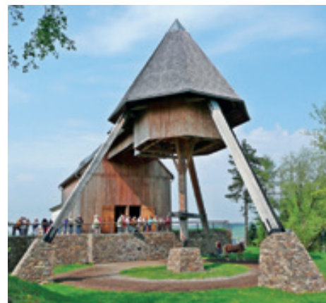
Košský žentour, Lauta

s tekoucí vodou nebo i na sucho, a vytříděná hlušina (neuzžitkovatelný materiál) se použila na zpevnění stěn nebo k zasypání dotěžených prostor.