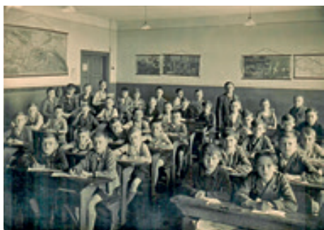
Chlapecká 3. třída, 1930

Dne 1. září začíná další školní rok a tak bylo téma rubriky jasné. Díky fotografiím se vrátíme do minulého století, tehdy byli žáci rozděleni do chlapeckých a dívčích tříd a v pedagogických sborech převládali muži, protože až do roku 1928 se ženy učitelky nesměly vdát a mít děti.