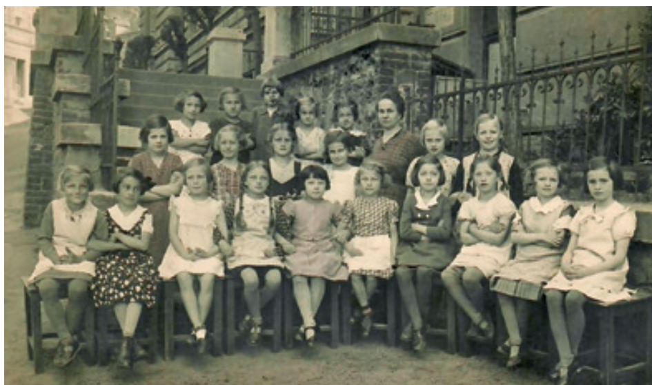
Dívčí 3. třída v ZŠ Teplická, 1930