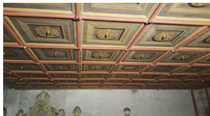
Ukázka části osazeného stropu v lodi kostela