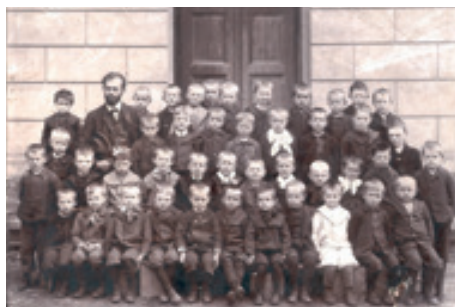
1. třída ZŠ Teplická, 1907