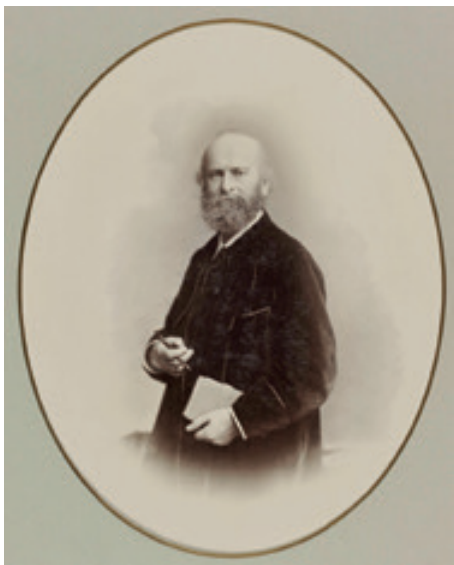
Franz Theodor Grosse (Wikimedia)

Německý malíř zabývající se malbou historických výjevů, krajiny a portrétů. Vystudoval sochařství a malířství na Drážďanské akademii umění. Mezi jeho první prestižní zakázky patřily nástěnné a stropní fresky v tanečním sále královského paláce v Drážďanech a v drážďanské obrazárně (Zwinger), kde je vystaven jeho nejznámější obraz Leda s labutí. Stipendium na studijní cestu do Itálie získal od Saské akademie díky úspěchu nástěnných maleb na zámku hraběcí rodiny Solms-Wildenfels. Tvorbu italských mistrů studoval ve Florencii a Římě. Po návratu do rodného Německa vymaloval lodžii muzea v Lipsku, zhotovil šablony pro porcelánku v Míšni a vytvořil několik velkých pláten s historickými a biblickými výjevy. O jeho výjimečných malířských schopnostech svědčí malby ve stylu slavného Raphaela na kazetovém