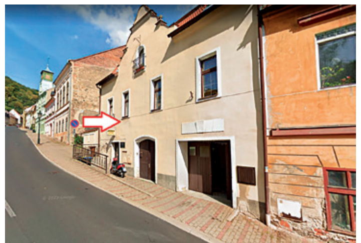
Obr. č. 4, Dům čp. 90 dnes