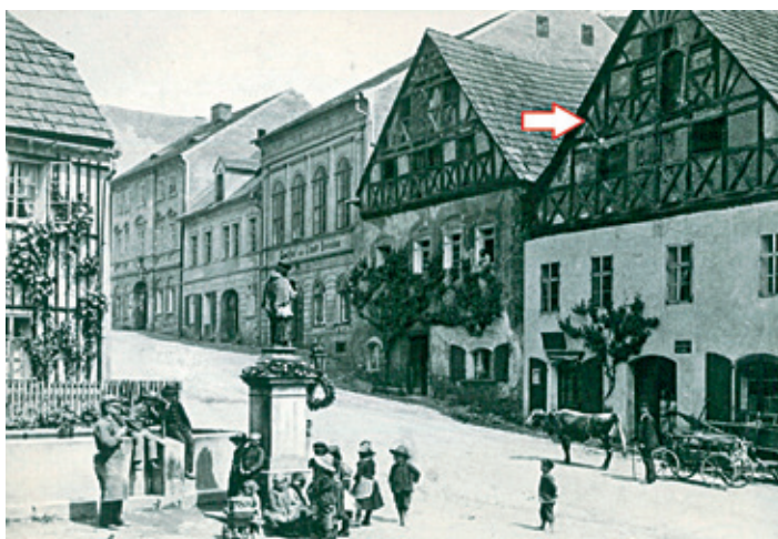
Obr. č. 3, Dům čp. 90 kolem roku 1900