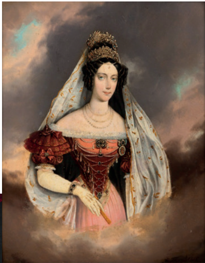
Marie Anna Karolina Pia Savojská

latiny, psal krásným kaligrafickým písmem, ovládal jízdu na koni i šerm a hrál na trubku i klavír, se zasloužila hlavně jeho macecha, Marie Ludovika Modenská, se kterou se císař František I. oženil po smrti Ferdinandovy matky v roce 1808. Ta mu sestavila učební plán a denně na výuku dohlížela. A mladý následník ji nezklamal, to, co se jiní učili roky, zvládl v řádu měsíců. Zapojil se do společenského života, navštěvoval operu i plesy. Pomáhal také s vyřizováním žádostí prosebníků a právě tehdy se projevil jeho laskavost a soucítění s chudými. Začalo se mu říkat Dobrotivý.