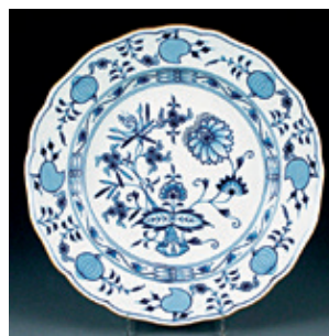
Míšeňský „cibulák“ zdobený kobaltovou modří