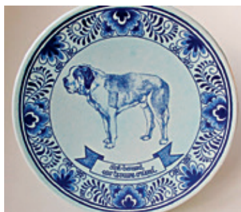
Keramika zvaná Delftská fajáns

Kobaltová modř z Krušných hor byla velmi žádaným vývozním artiklem. Nepostradatelnou se stala pro