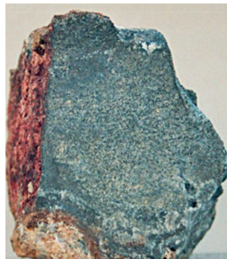
Kobaltová ruda

porcelánu v Míšni, v Holandsku sloužila k výrobě slavné keramiky zvané delftská fajáns. Najdeme ji na čínském porcelánu i benátském skle.