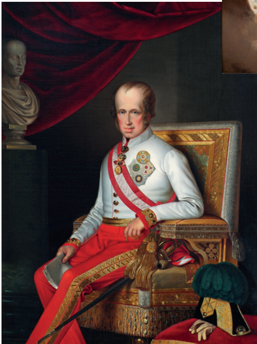
Rakouský císař Ferdinand I. Dobrotivý