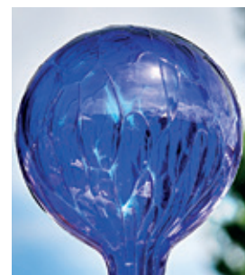
Kobaltová modř – sklo (Wikimedia)