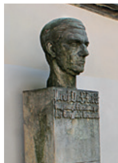
Busta MUDr. Arlta před kostelem Nanebevzetí Panny Marie

Vychodil obecnou školu v Novosedlicích, absolvoval gymnázium v Lito-měřicích a vystudoval lékařskou fakultu v Praze. V roce 1849 se stal profesorem Karlovy univerzity. Od roku 1856 působil na univerzitě ve Vídni. Napsal řadu vědeckých studií, spoluvydával odborný časopis o oftalmologii a proslavil se skvěle prováděnými operacemi šedého zákalu a úspěšnou léčbou šilhavosti. Za své zásluhy byl povýšen do šlechtického stavu s přídomkem „von Bergschmied“, který odkazuje na jeho původ z rodiny důlního kováře.