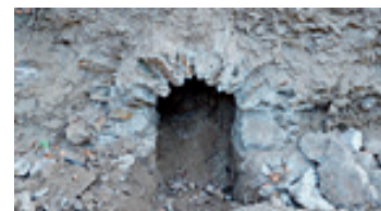
Pravděpodobně odtoková šachta z hradebního jádra