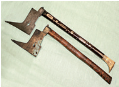
Švancary, sekury důlních tesařů

Původní tesařskou sekuru si pro své potřeby upravili štajgrři, důlní dozorcí, kteří dohlíželi na bezpečnost provozu i na práci horníků. Vznikla praktická hůl, o kterou se mohli při pochůzkách podzemím nejen opírat, ale hlavně ji používali ke zjišťování dutin ve