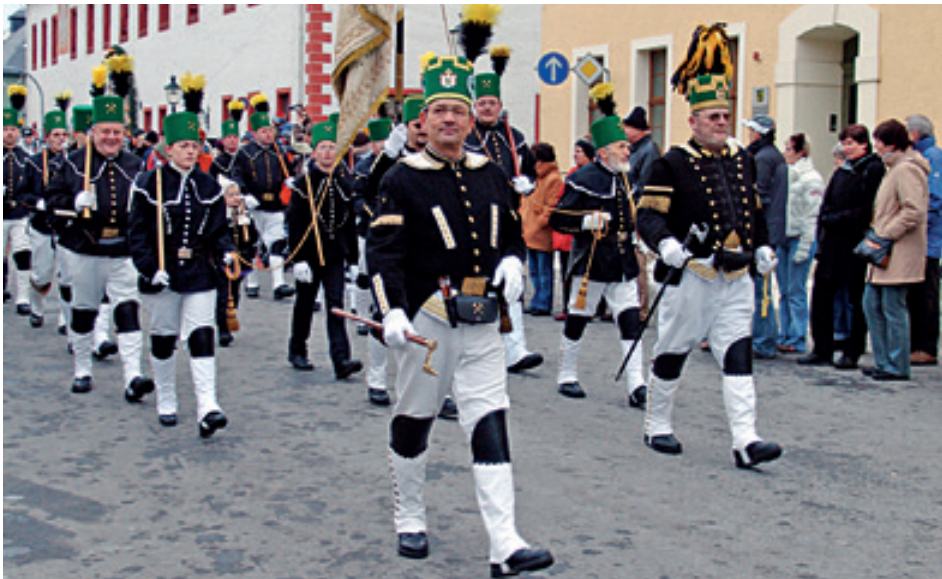
Slavnostní hornický průvod, Marienberg

S hornickou tradicí jsou spjaté symboly, které se po celá staletí prolínají životem všech havířů. Jsou nedílnou součástí historie hornických obcí a měst nejen v Krušnohoří, ale i v dalších hornických regionech.