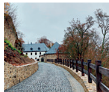
Nově opravený stav

Část nálezů bude vystavena v infocentru v Husitské ulici, kde si je budete moci prohlédnout. Archeologický výzkum byl obohacen o další torzální nálezy starého historického zdiva, jmenovitě torzo objektu obdélníkového tvaru, kamenné klenby a pozůstatků kamenného zdiva, které byly zakonzervovány a zachovány pro příští generace.