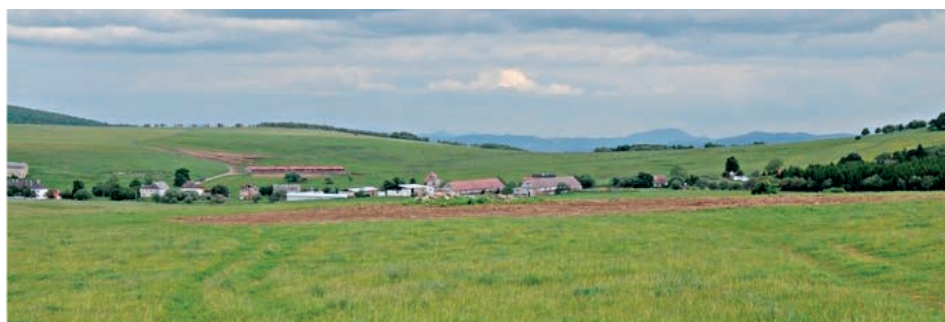
Pohled na současný stav území

Rekonstrukce muzea začala letos v březnu a na konci října mělo být hotovo. Přestavba budovy a následně i expozic má stát dohromady asi 70 milionů korun. Ani jejím oddálením by se však částka neměla navýšit. „Předpokládáme, že se projekt neprodrazí, a to zejména proto, že ho rozdělíme na dvě části – na stavební a expoziční. Pořád se tedy počítá s částkou ve výši přibližně 70 milionů korun. Z dotace bychom přitom mohli čerpat až 48 milionů korun,“ doplnil Řehák s tím, že časový posun odhaduje na rok až dva. /red/