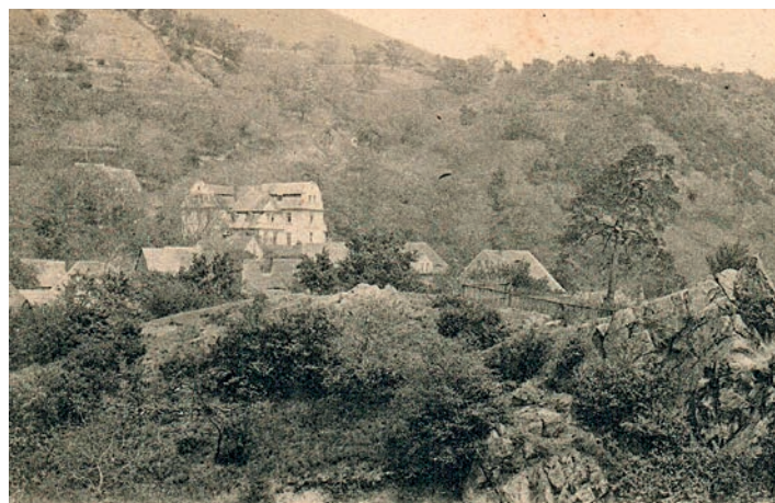
Vila Heinrichovo zátíší