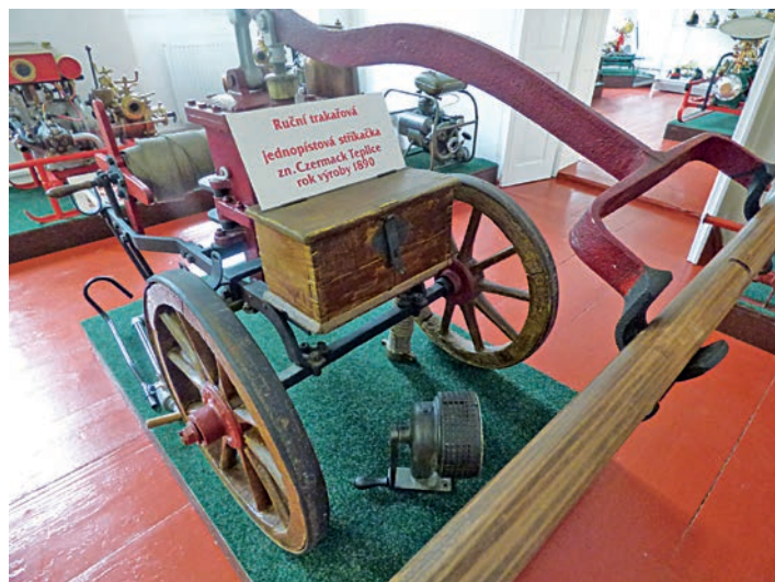
Ruční jednopístová stříkačka firmy Czermack z r. 1890 (Hasičské muzeum Krupka)