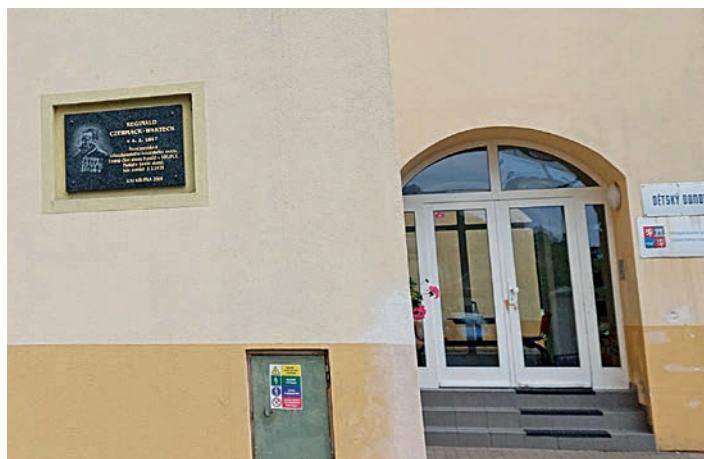
Pamětní deska na budově dětského domova v Krupce