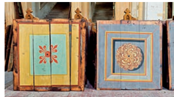
Ukázka přemalované stropní kazety a kazety s původní malbou po zrestaurování