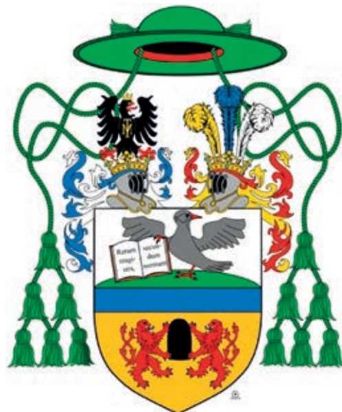
Kindermannův biskupský znak