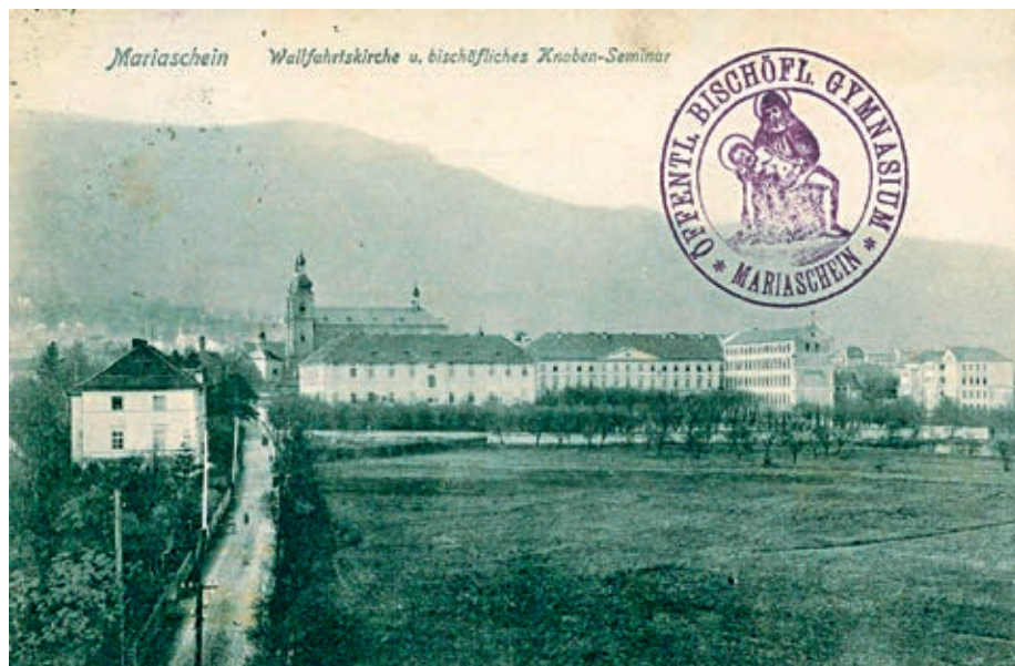
Biskupské gymnázium Bohosudov