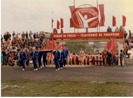
Brána borců, 1980