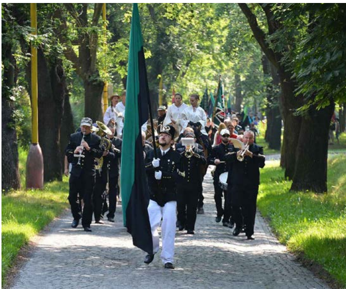
Hornické slavnosti Příbram

V červnové Radnici se seznámíme s hornickými profesemi.