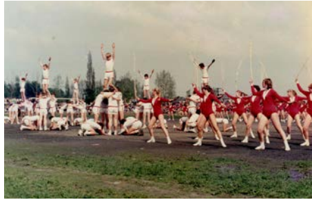
Učňovská mládež, 1980