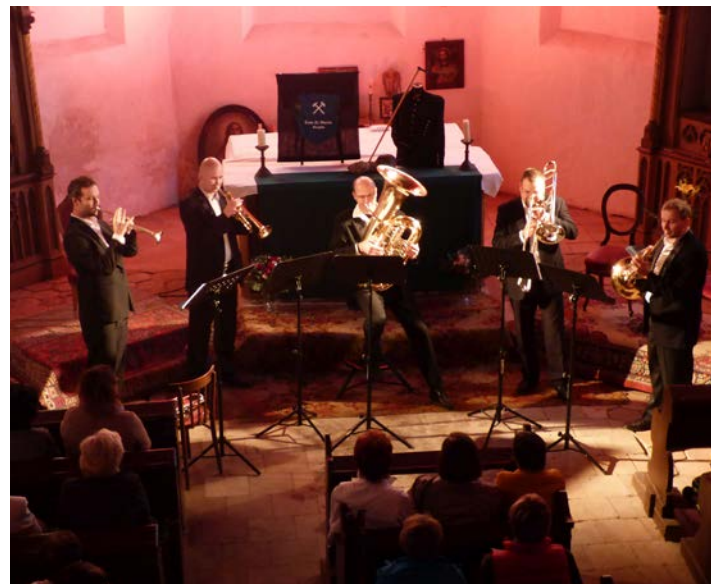
Zdař Bůh! Krupka, 2017