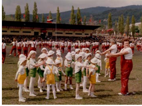
Rodiče a děti, 1980