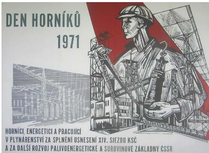
Plakát z roku 1971