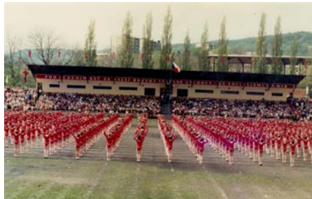
Starší žákyně Poupata, 1985