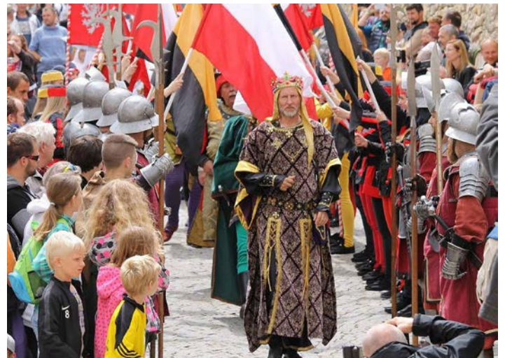
Královské stříbření Kutná hora (Kutnohorský deník)

Hornický region Erzgebirge/Krušnohoří je památkou světového dědictví UNESCO